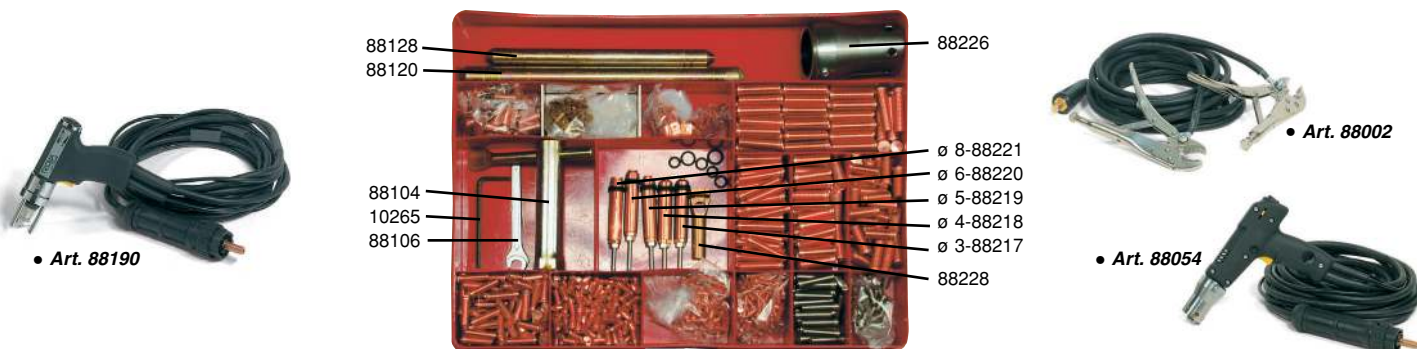
● Kit perni, Boccole, Faston - Kit of studs, Bushes, Faston - Kit pernos, Pernos de rosca interior, Faston

● Standard / Standard / Standard ○ Su richiesta / On request / Bajo demanda